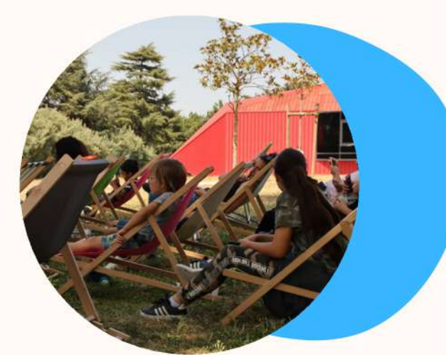
Sieste musicale / Sieste sonore participative