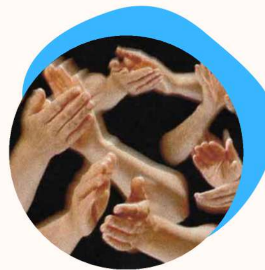
Atelier percussions corporelles