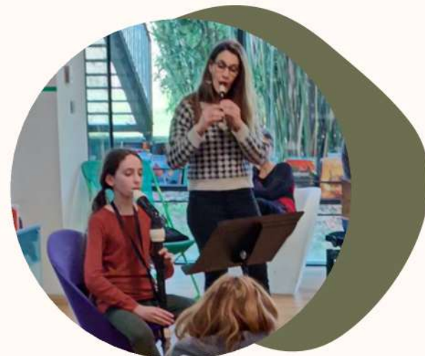
Découverte d'instruments avec le conservatoire